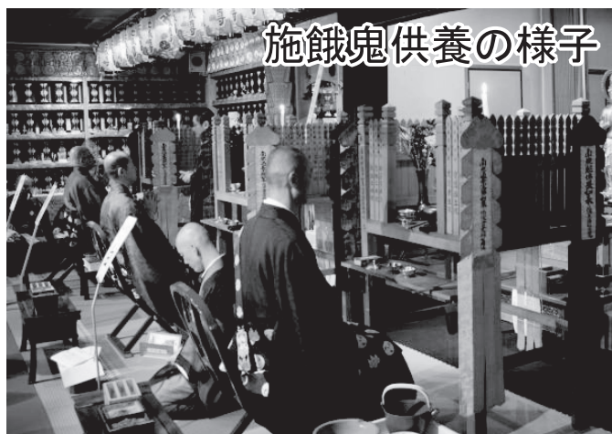
施餓鬼供養の様子